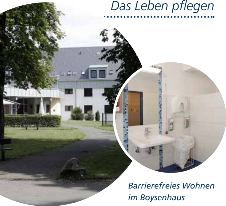
Barrierefreies Wohnen im Boysenhaus