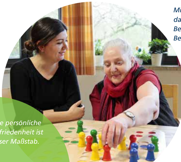
Ihre persönliche Zufriedenheit ist unser Maßstab.